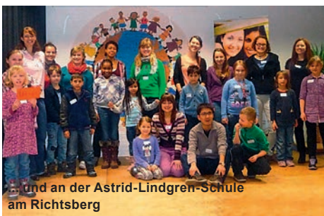
... und an der Astrid-Lindgren-Schule am Richtsberg