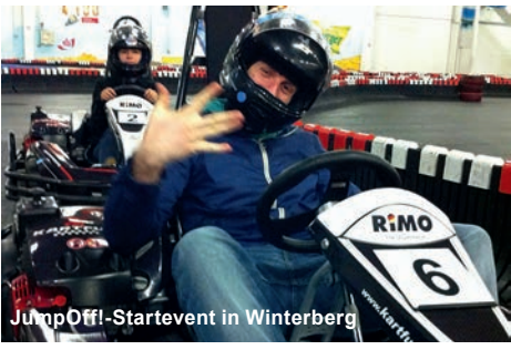
JumpOff!-Startevent in Winterberg