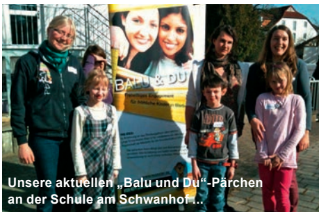
Unsere aktuellen „Balu und Du“-Pärchen an der Schule am Schwanhof...