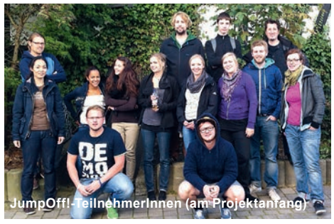
JumpOff!-TeilnehmerInnen (am Projektanfang)

Interessen und Kompetenzen ausgelotet, anschließend gemeinsam eine Bewerbung verfasst und so letztlich die Zusage für ein zweiwöchiges Praktikum in einem Marburger Autohaus erhalten.