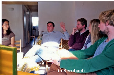
... in Kernbach