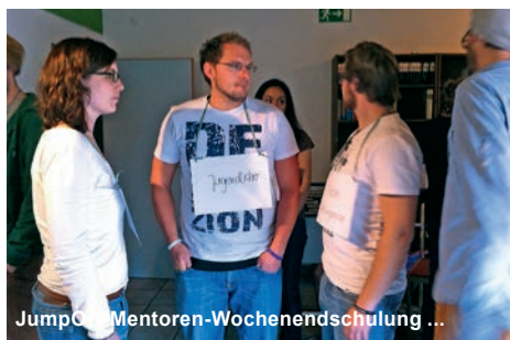
JumpOff! Mentoren-Wochenendschulung ...