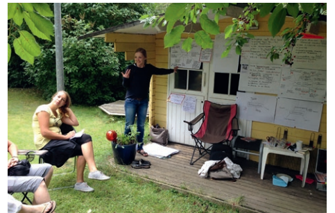
Ein paar Impressionen von unserem sehr schönen Sommerfest (u.a. mit OB Egon Vaupel und WM-Übertragung) und unserem Visions-Tag.