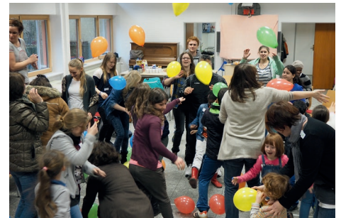
Eine neue Balu-Runde startet ...

und Du“. Viele werden sich weiter treffen, alle zwei Wochen oder auch jede Woche, denn aus den Patenschaften sind Freundschaften geworden, auf die man nicht mehr verzichten will. Und für diejenigen, deren Wege getrennt weiter gehen, bleibt eine wichtige Erinnerung: Ich hatte mal einen Balu – ich hatte mal einen Mogli und das ist etwas ganz Besonderes!